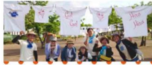
富山Tシャツアート展 in 立山Craft2017

5月27・28日に富山県立山町総合公園で開催された立山Craft 2017にて、クラフトマーケットの入り口を飾った約170枚のひらひら。立山連峰を望む爽やかな会場では、ステンシルで作るTシャツワークショップも大人気でした。各地のすなびファミリーも応援に!