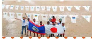
ペリズとつながる ひらひらプロジェクト

誰も想像しなかった 棚田でのひらひら。海 から飛んできた種が、 山にも根を下ろしはじ めています。