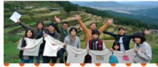
棚田Tシャツ アート展2017

青い海と飛行機! 世界にひとつのTシャ ツが風のリズムに合 わせて踊る姿に、胸が いっぱいになりました。