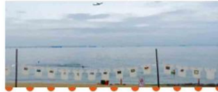
Tシャツアート展 in とこなめ2017

ひらひらを見れば みんな笑顔!多くの 人の関わりで富山に 作られたこの風景、本当 にうれしいです。